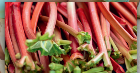
Rhabarber: Nicht nur als Schorlenzusatz beliebt