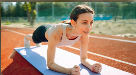
Sport: Trendsport HIIT einfach erklärt

Kleine Tricks für mehr Energie und Aktivität