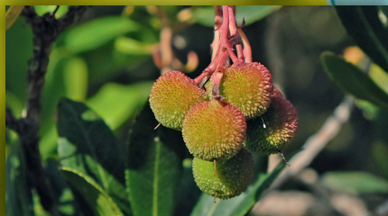
Vorgestellt: Der Erdbeerbaum